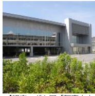
【認定こども園「阪南市立総合こども館」(仮称)の予定地】