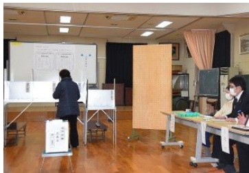
投票所に足を運んだ有権者(左) = 石川県輪島市で2017年2月19日

石川県輪島市門前町大釜地区に計画されている産業廃棄物処分場建設の是非を巡り、同市で住民投票が19日、行われた。投票率は42.02%で、規定の50%を下回り、投票は不成立となった。投票日を前に、建設を推進する市議会最大の自民系会派は「棄権」を呼びかけて投票不成立に向けた運動を展開し、専門家からは「住民投票の趣旨に反する」と問題視する声も