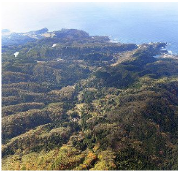
産廃処分場建設が計画されている石川県輪島市門前町大釜地区一帯 = 2016年11月7日

輪島市門前町大釜地区に、産業廃棄物の最終処分場建設が計画され、市民団体が住民投票では是非を問うよう求める署名活動を進めている。十数年前に浮上した処分場計画は市民や市議会の反対で立ち消えになったとみられていたが、今年に入り、市や市議会が推進に転じ、市民が民意を問おうと立ち上がった。団体側は25日、署名数が住民投票実施に必要な6分の1を超えたと発表、実現の公算が大きくなった。奥能登有数の観光地である輪島市は迷惑施設建設を巡り大きく揺れている。