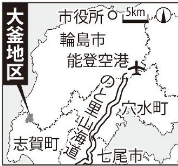
産廃処分場建設が計画されている石川県輪島市門前町大釜地区

そんな中、昨年5月に計画が再び動き出した。同社が、処分場の処理済み排水を川に流す当初計画を改め、市の下水処理施設にいったん流して再処理する案を示した。市や、建設の許可権を持つ県が条件付きで検討する意向を表明。市議会は今年6月、関連議案を賛成多数で決め、処分場建設を事実上容認した。